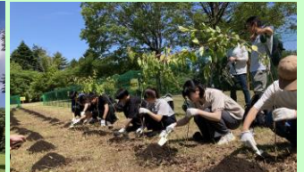
2024年5月の植樹イベント

植樹ご希望の方は、スタート受付時にスタッフにお申し出ください。「植樹券」を配布いたします。なお、植樹券の配布は先着50組さまとさせていただきます。