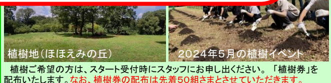
植樹地(ほほえみの丘)